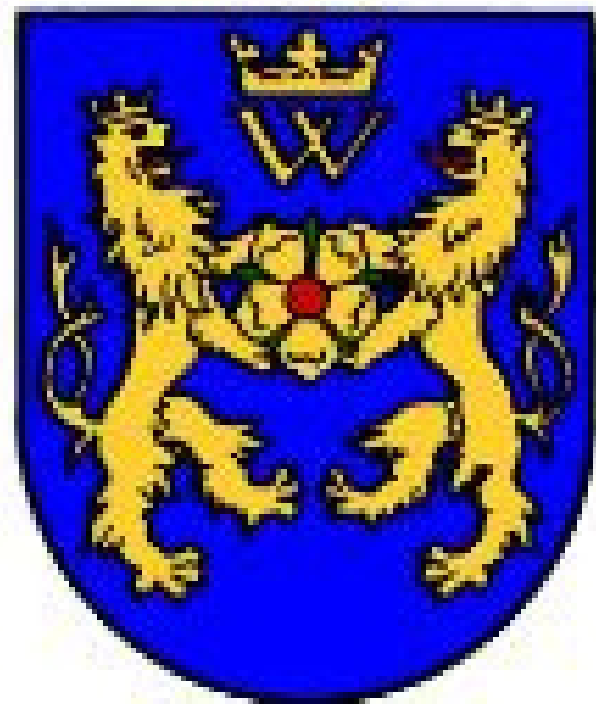
MĚSTO JINDŘICHŮV HRADEC